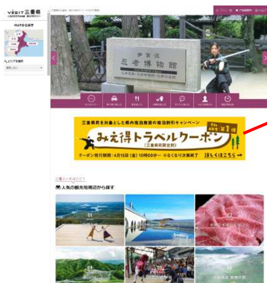
<「VISIT三重県」のトップページ>