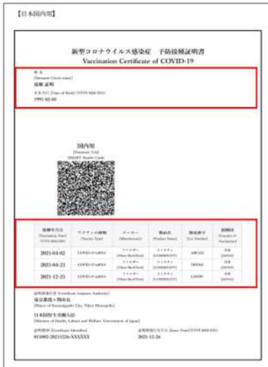
【予防接種証明書（国内）】