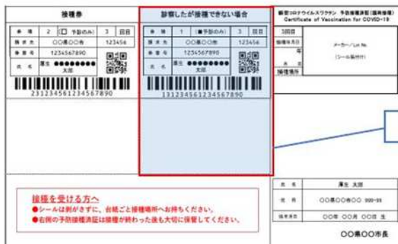
【追加接種用の接種券兼接種済証】